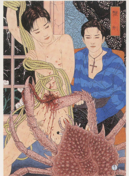
蟹刑 1997 300×210mm