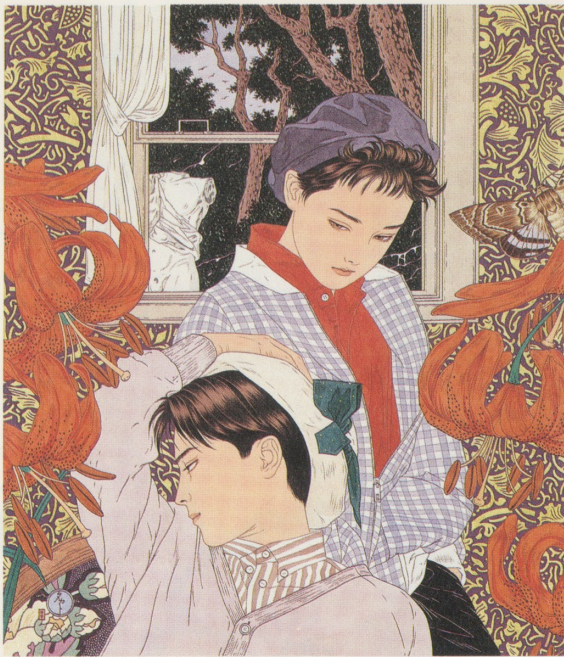
百合の誘惑 1997 280×240mm