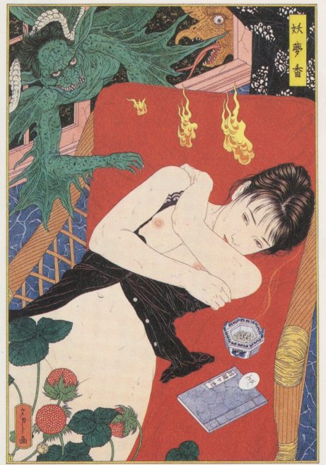
妖夢香 1996 300×203mm