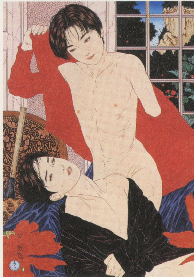
甘い欺惑 1996 300×210mm