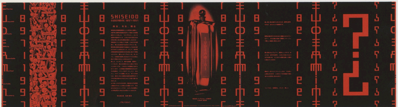
資生堂「オイデルミン」の雑誌広告

今回は、1997年5月から1998年4月までの間に発表・使用・掲載された作品、約8,500点の応募がありました。その中から、日本の代表的なアートディレクター79名で構成される東京アートディレクターズクラブが、4日間にわたる審査会で、厳しく選んだ受賞作品・優秀作品を2つの会場で展示いたします。日本のグラフィックデザインの質的なレベルの高さは世界的な評価を得ていますが、東京アートディレクターズクラブが選定するグランプリをはじめとするADC各賞は、最も権威あるものとして、毎年、各方面から、注目を集めています。審査によって選ばれたポスター、新聞広告、雑誌広告から、テレビコマーシャル、エディトリアルデザイン、パッケージ、ロゴタイプなど、多様なジャンルの優れた作品は、「ADC年鑑」に収録されて、わが国だけでなく海外にも広く紹介されます。年鑑の発行に先立って、日本のアートディレクションの精髓を、ごらんいただけます。(東京アートディレクターズクラブ)