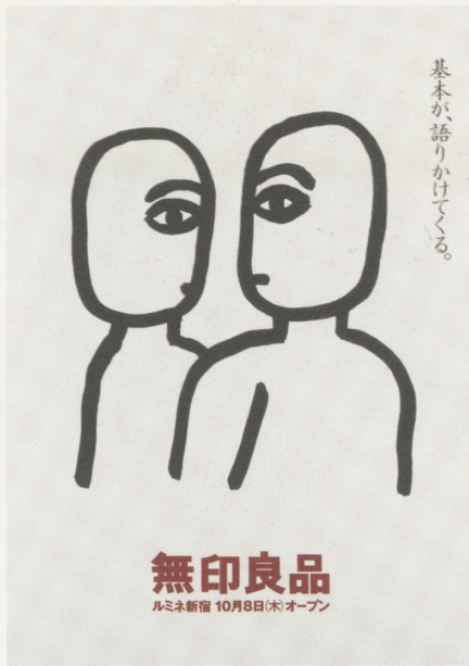
ill: Yuzo Yamashita