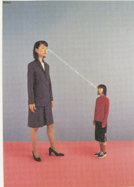
明日の自分を、語ろう。