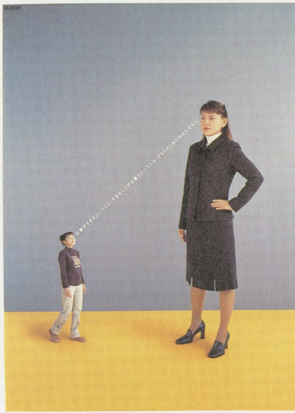
明日の自分を、語ろう。