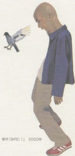
新作「BIRD 1」 2000年

[BLUE] [RED] 各会場先着1000名様に、井筒啓之オリジナル「しおり」を差し上げます。