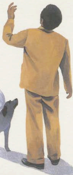
浅田次郎「天国までの百マイル」 朝日新聞社 1998年

井筒啓之 Hiroyuki Izutsu 1955年香川県生まれ東京育ち。セツ・モードセミナー卒業。'98年講談社出版文化賞さし絵賞受賞。東京イラストレーターズ・ソサエティ会員。文芸誌や単行本、文庫本などの挿絵や装幀画を主に描いている。浅田次郎「鉄道員(ぼっぼや)」「天国までの百マイル」、宮部みゆき「人質カノン」装画、映画「天国までの百マイル」ポスター、藤堂志津子「海の時計」新聞小説、柳美里「家族の標本」「ことばのレッスン」挿絵等。