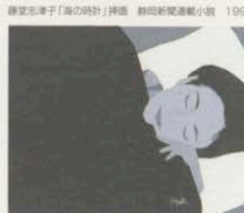
藤堂志津子「海の時計」挿画 静岡新聞連載小説 1995~1996年

同時開催◎Pinpoint Gallery 井筒啓之 原画展 [RED] 2001年1月15日(月)→1月27日(土) 11:00A.M.~7:00P.M. (土曜日は5:00P.M.まで) 日曜日休館 入場無料 〒107-0062 東京都港区南青山5-10-1 二葉ビルB1 TEL.03-3409-8268 http://www.kt.rim.or.jp/~pinpoint/