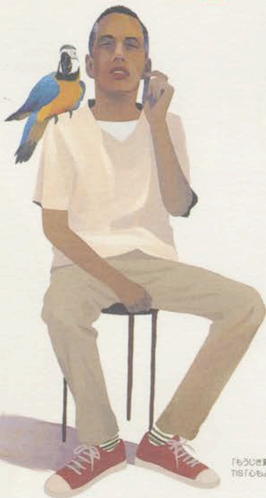
「もうじき夏がくる」 TIS「心もよう」展出品作 1997年

●オープニングパーティー 2001年1月9日(火) 7:00P.M.より行います。