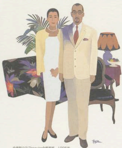
会員制クラブ「require」会報表紙 1995年