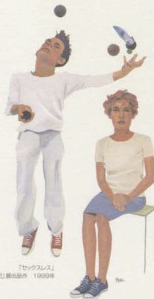
「セックス」 TIS「ことばの20世紀」展出品作 1999年

同時開催◎Pinpoint Gallery 井筒啓之 原画展 [RED] 2001年1月15日(月)→1月27日(土) 11:00A.M.~7:00P.M. (土曜日は5:00P.M.まで) 日曜日休館 入場無料 〒107-0062 東京都港区南青山5-10-1 二葉ビルB1 TEL.03-3409-8268 http://www.kt.rim.or.jp/~pinpoint/