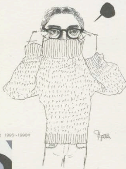
柳 美里「ことばのレッスン」挿画 朝日新聞社「週刊朝日」 1996年