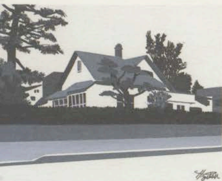
藤堂志津子「海の時計」挿画 静岡新聞連載小説 1995~1996年

改めて過去の作品を見渡すと、やはり僕は挿絵が好きなのだと思う。文芸誌等に描いた作品や単行本の装幀画等を中心に、私的要素の高い作品、あるいは未発表の新作を潜ませ皆様に楽しんで頂けたらと考えている。 井筒啓之