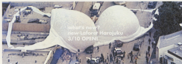
ラフォーレ原宿「Giant Bra」のポスター