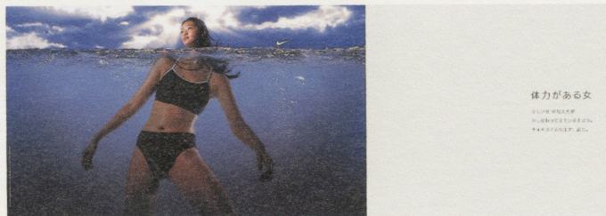
ナイキジャパン「ナイキ スイム キャンペーン」のポスター

過去1年間(2000年5月-2001年4月)に発表・使用・掲載された約10,000点の応募作品を日本を代表するアートディレクター85名で構成される東京アートディレクターズクラブが4日間にわたり審査。選びぬかれた受賞作品、優秀作品を2つの会場で展示いたします。ポスター、新聞・雑誌広告、テレビコマーシャル、エディトリアルデザイン、パッケージ、ロゴタイプ、ディスプレイなど、あらゆるジャンルにわたる作品群は、「ADC年鑑」に収録されて、広く海外にも紹介されます。年鑑の発行に先立ち日本のアートディレクションの最新の代表作にライブで触れてください。(東京アートディレクターズクラブ)