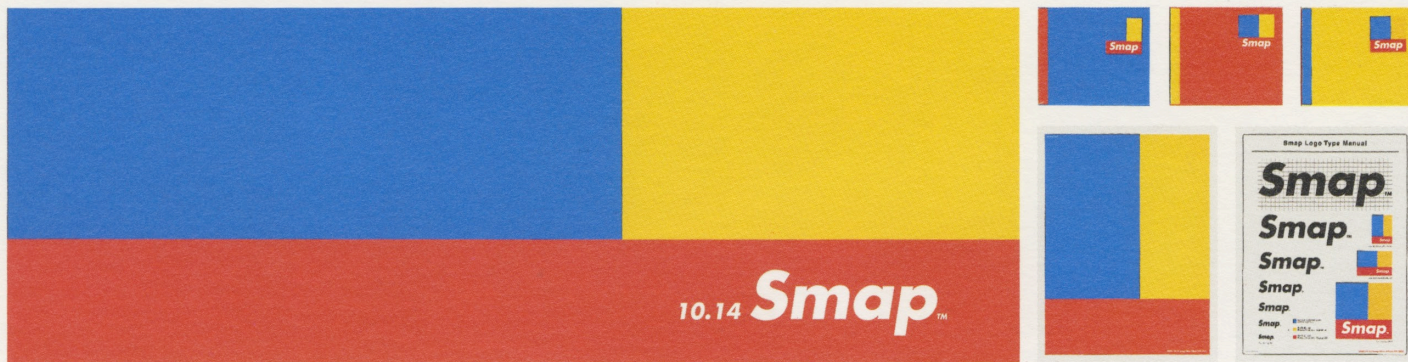
ビクターエンタテインメント「Smap」のポスター、新聞広告、グラフィックデザイン