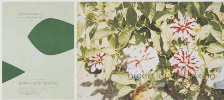
ユナイテッドアローズ「グリーンレーベルリラクシング」の新聞広告