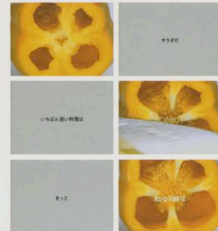
キュービー「キュービーマヨネーズ」のテレビコマーシャル