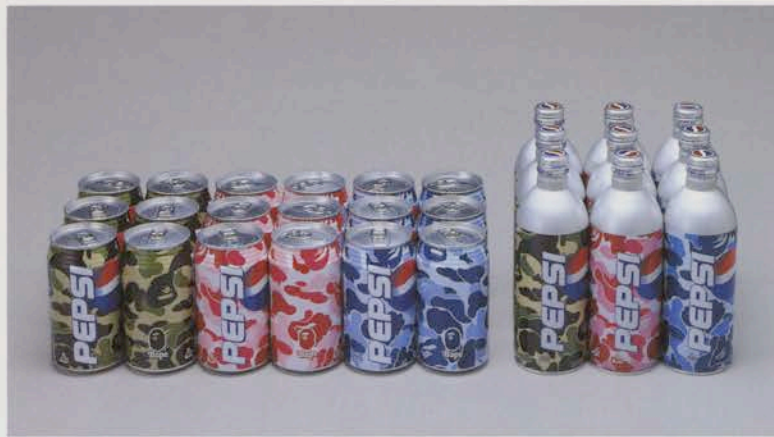
サントリー「Bathing Ape x PEPSI」のパッケージデザイン