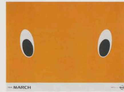
日産自動車「new MARCH」のポスター