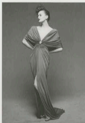
写真集『植田いつ子の世界』より 1983年