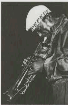
マイルス・デイビス 1981年