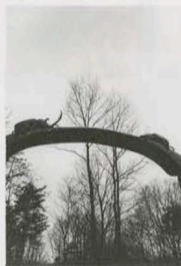
写真集『武蔵野』より 1997年