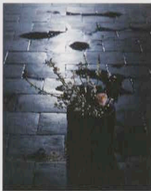
写真集『楠目ちづ 花』より 1992年