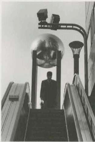
写真集『Tokyo X』より 2000年