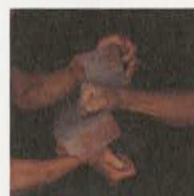
写真集「大山信通 空手 極限の世界」1984