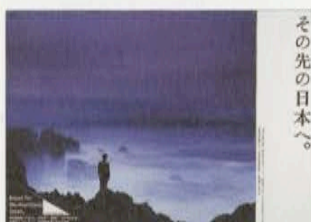
JR東日本 ポスター 1993