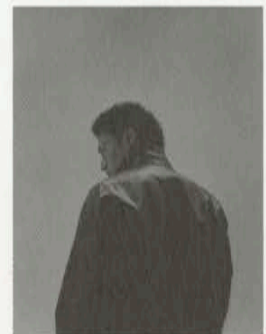
「広告批評」伊勢谷友介 2001