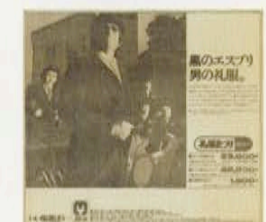
スリーM 新聞広告 1974