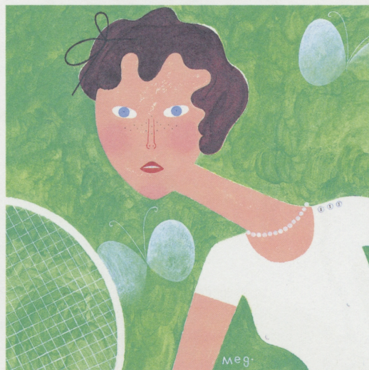
メグホソキ「蝶々のテニス」