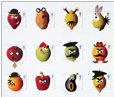
Royal Mail 切手デザイン 2003