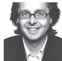
マイケル・ジョンソン / Michael Johnson

過去10年間で最多受賞歴を誇るヨーロッパ屈指のグラフィックデザイナー。シドニーやメルボルン、そして東京と世界各地のデザイン業界で経験を積み、1992年にロンドンでジョンソン・バンクス (Johnson banks) 設立。グラフィックデザインとブランド設定に携わり、大規模な文化・政府機関、大企業といったクライアントを中心にコミュニケーションのアイデアを提供するスペシャリスト企業となる。英国紙 Independent の「最も著名なイギリス人デザイナー10名」のうちの一人に選出され、2003年の Design Week ではデザイン業界で最も影響力のある人物で構成される、名譽ある「Hot 50」リストに取り上げられた。2003年のプロジェクト、Royal Mail (英国郵政公社) からの依頼作品であるシールタイプの切手セットはロンドンのデザイン・ミュージアム選出のその年のベストデザイン10点に選ばれ、イェローベニシイルの名で親しまれるD&AD賞でも、グラフィックデザイン部門で21年ぶりにブラックペンシル賞(金賞)を受賞。Design Week Award of the Best of Show、第83回NY.ADC賞銀賞をも獲得した。コミュニケーションについての著作「Problem Solved」(Phaidon Press 社刊、2002年)はベストセラーとなり、数々の展覧会の共同キュレーター、Glasgow School of Art 外部審査委員、2003年D&AD会長を務めるなど、活躍は目覚ましい。主なクライアントに英国政府、デザイン・カウンシル、Royal Mail、ヴィクトリア&アルバート博物館、ラ・ヴィレット公園(パリ)、ATカーニー(ワシントン)等がある。www.johnsonbanks.co.uk