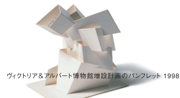
ヴィクトリア&アルバート博物館増設設計画のパンフレット 1998

グラフィック・デザインの世界的な中心地はどこかと聞かれれば、私はロンドン、ニューヨーク、東京と答えます。これらの都市にはデザインの伝統が強く息づいています。初の単独エキシビションが、東京で開催されることになり、本当にうれしく思います。