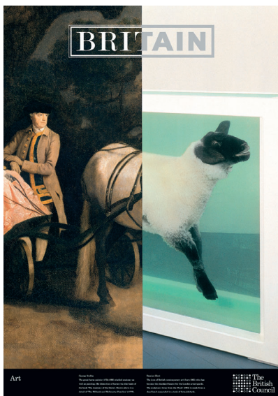
BRITAIN ポスターキャンペーン 1998