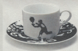
リチャード・ケール