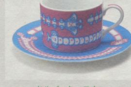
ドルパッキーヨウコ