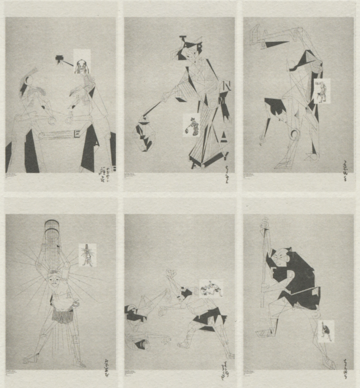
第17回亀倉雄策賞受賞作品「HOKUSAI_LINE」

主催：クリエイションギャラリーG8 共催：公益社団法人日本グラフィックデザイナー協会 亀倉雄策賞事務局 協力：大洋印刷株式会社