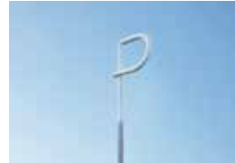
my CLINIC「my CLINIC」の環境空間