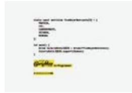
大塚製薬「CalorieMate to Programmer」の ポスター、ウェブサイト