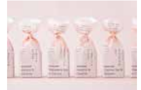
imperfect「imperfect」のパッケージデザイン