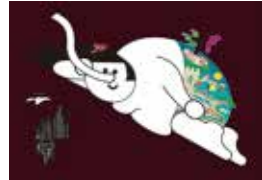
リクルートホールディングス「dou?」の ポスター、ジェネラルグラフィック