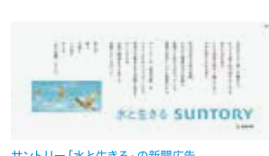
サントリー「水と生きる」の新聞広告