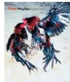
サンエンターテインメントカルチャージャパン、 リトル・モア「Chaos」のブック&エディトリアル