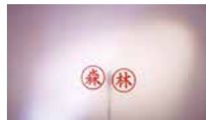
シヤチハタ「印影漫才師ふおれずと」の ウェブムービー