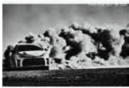
トヨタ自動車「GR YARIS」のポスター、 コマーシャルフィルム