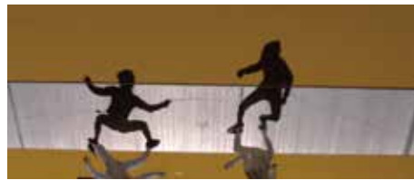
日本オリンピック委員会「Shadows as Athletes」の映像