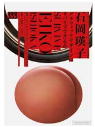
ギンザ・グラフィック・ギャラリー、エヌ・ジー 「EIKO ISHIOKA」のグラフィック、VI