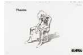
豊島園「としまへん 最後の広告 Thanks」の 新聞広告