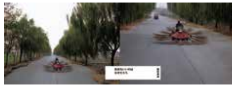
良品計画「無印良品 気持ちいいのはなぜだろう。」のポスター、新聞広告、 雑誌広告、ブック&エディトリアル、コマーシャルフィルム、ウェブサイト