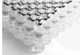
イッセイミヤケ「ISSEY MIYAKE SEMBA」の ジェネラルグラフィック、環境空間