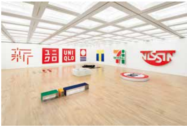
国立新美術館、SAMURAI、TBS グロウディア、BS-TBS、朝日新聞社、TBSラジオ、TBS、びあ 「佐藤可士和展 国立新美術館」の環境空間