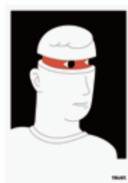
Study and Design 「vermilion」のポスター ジェネラルグラフィック