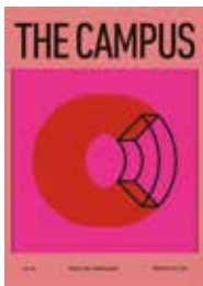
コクヨ「複合施設 THE CAMPUS」のポスター、 ジェネラルグラフィック