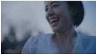
サントリー「天然水 2021」のポスター、 コマーシャルフィルム