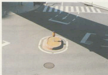
金子真由美 KANEKO MAYUMI 1976年生まれ。江戸川女子短期大学人文学科卒業。 現在、パンタンJカレッジ夜間部在学中。 【STAY NATURAL】