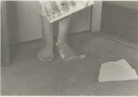
伊藤潮 ITO USHIO