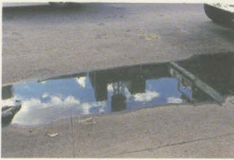
広川智基 HIROKAWA TOMOKI