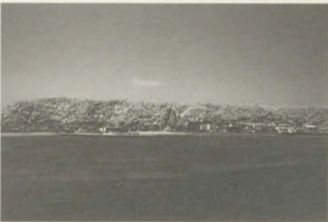
横澤典 YOKOZAWA TSUKASA

1967年生まれ。信州大学農学部卒業。現在、カメラマン。 東京総合写真専門学校写真芸術第2学科。 「AWAY」