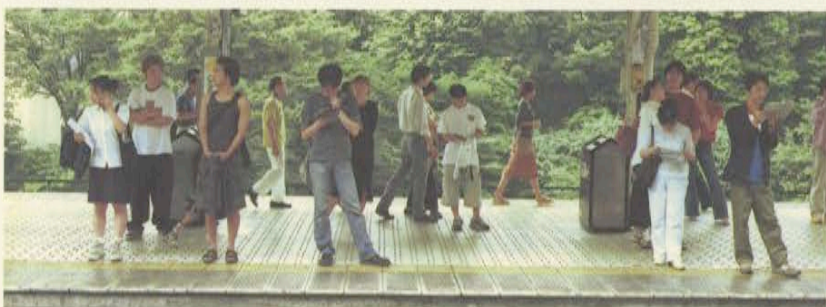
杉山隆史 SUGIYAMA TAKASHI 1972年生まれ。東京総合写真専門学校卒業 『YELLOW LINE』