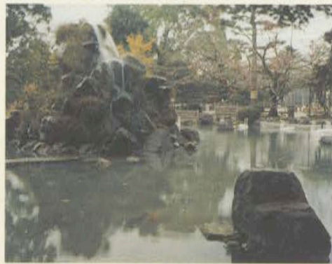
小栢健太 OGAYA KENTA 1977年生まれ。 京都市立芸術大学彫刻専攻4年生 『landscape -Japon-』