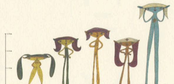
三宅信太郎 MIYAKE SHINTARO 1970年生まれ。アルバイト 『sweet girl SWEET』