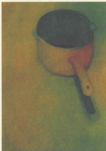
植草美里 UEKUSA MISATO 1978年生まれ。京都市立芸術大学美術科卒業。アルバイト 『There are just the things here! —びったりなもの—』