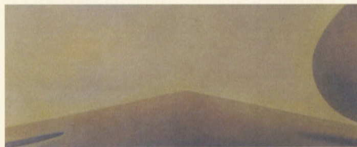
御法川哲郎 MINORIKAWA TETSUROU 1976年生まれ。多摩美術大学グラフィックデザイン学科卒業。会社員 『—————』