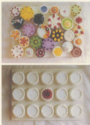
渡辺理 WATANABE OSAMU 1980年生まれ。東京造形大学造形学部デザイン学科3年生 『Rejoisel!』