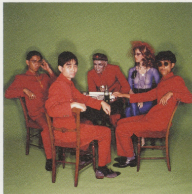
YMO「Solid State Survivor」1979