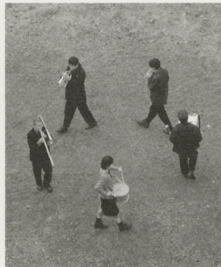
映画「ワンダフルライフ」1999

1970年代、衝撃的にデビューしたT.REX、デヴィッド・ボウイなどのミュージシャンを撮り、見る側に強烈な印象を残した鋤田正義。鋤田氏はメンズ・ファッションブランド「JAZZ」の広告(1965~1970年)で、1971年にADC賞を受賞、ドラマにあふれた写真は注目を集めました。1969年のウッドストックに刺激され、その空気を肌で感じたいと、ニューヨーク、そしてロンドンへ。マーク・ボランやデヴィッド・ボウイの撮影を通して知ったサブカルチャーに魅了され、以後、数々のミュージシャンとの仕事から、映画、広告など、その活躍の場を多岐に広げてきました。「僕はミーハーなんです」の言葉通り、自分の興味や好奇心に素直に行動し、その被写体を夢中で撮り続けた鋤田氏。本展では、そんな写真家鋤田正義の約50年間を二会場で一挙にご紹介します。