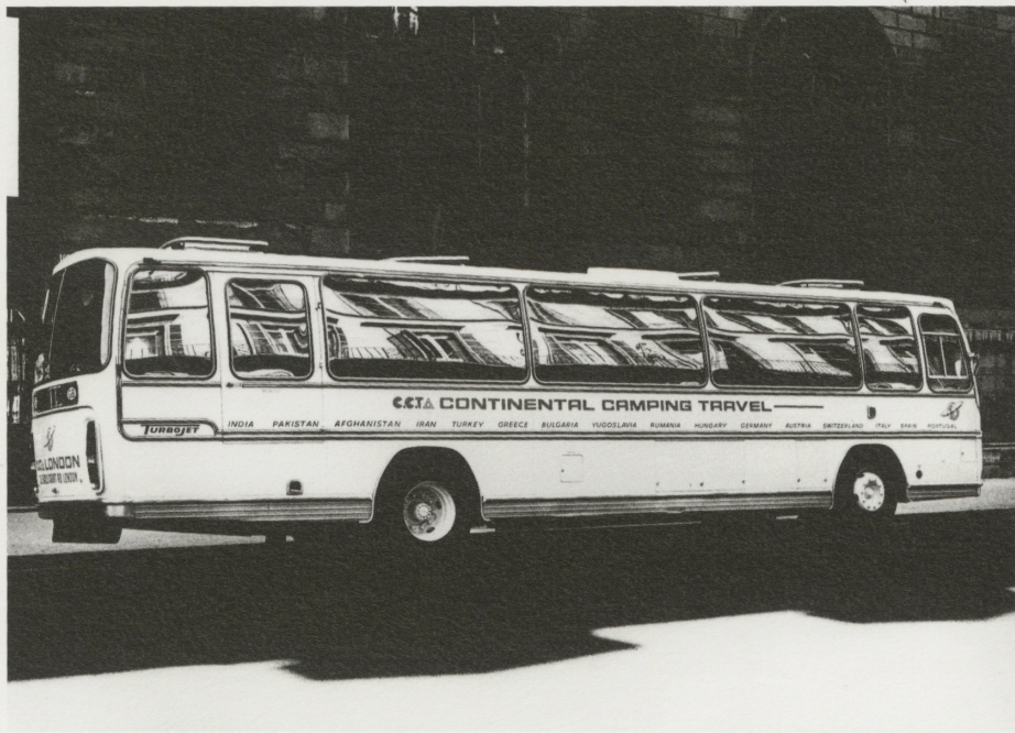
「20世紀がくれたもの／のりもの・プラス...」