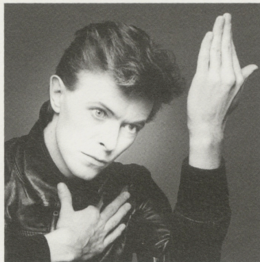
デヴィッド・ボウイ 1977