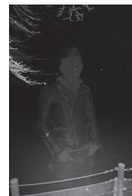
グランプリ受賞作品 『King of the night, Tokyo Japan』