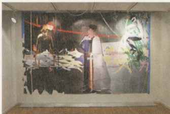
第8回グラフィック「1_WALL」展の展示作品「reach」