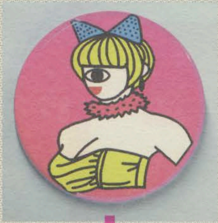
LEE KAN KYO

[オープニングパーティー: 2014年3月6日|木| 20:30 → 21:30 (予定) at ガーディアン・ガーデン]