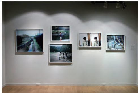
第8回写真「1_WALL」展の展示作品「水辺の子ども」