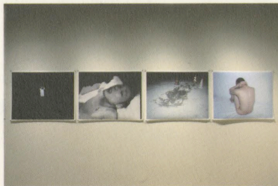
第9回写真「1_WALL」展の展示作品「Marginal Man is Dead」