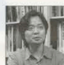
飯沢耕太郎 写真評論家

1954年宮城県生まれ。1984年筑波大学大学院芸術学術研究科修了。1990～94年季刊写真誌「デジャヴ」の編集長をつとめる。近著に「写真集が時代をつくる!」(シーエムエス)、「日本現代写真アーカイブ2011～2013」(青弓社)など。