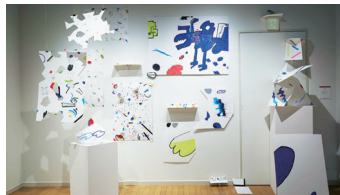
第12回グラフィック「1_WALL」展の展示作品 「KREUZBERG」