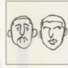
大日本タイポ組合

1988年埼玉県深谷市生まれ。各種印刷メディア、広告媒体、webコンテンツなどに幅広くイラストを提供している。最近の仕事に「BRUTUS」本誌の表紙シリーズ、GUのSALEビジュアルやLINEスタンプなど、クライアントワークの他、自身の作品集の制作や個展開催、企画展への参加など多数。