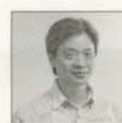
飯沢耕太郎 写真評論家

1954年宮城県生まれ。1984年筑波大学大学院芸術学研究科修了。1990～94年季刊写真誌「デジャヴ」の編集長をつとめる。近著に「写真集が時代をつくる」(シーエムエス)、「現代日本写真アーカイブ2011-2013」(青弓社)など。