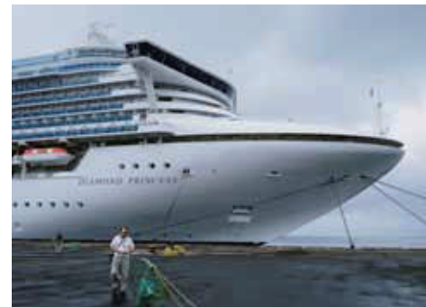
左：「山のまぼろし」 マルチスライドプロジェクション、音、ラムダプリント 茨城県北芸術祭 2016 (2016) 中：「ここがどこだか、知っている。」 影像2013 (2013) 右：写真集『船と船の間を歩く』 鳥取藝住祭 2014 (2014)