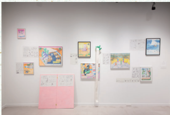
第17回グラフィック「1_WALL」展览展示作品 「こんにちは!!」ザ・ワールド」

第17回グラフィック「1_WALL」展 2017年10月3日[火] - 10月27日[金]