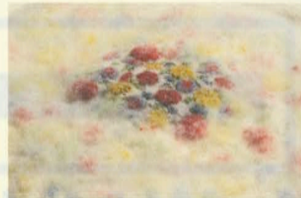
佐々木彩音 Ayane Sasaki