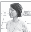
長崎訓子 (イラストレーター)

1962年東京生まれ。武蔵野美術大学卒業。1980年代から2000年代までにグラフィック系コンペや広告賞で多数受賞。2010年「ニューエイドス」、2013年「都築潤×中ザワヒデキ」を展示開催。2015年「ニューエイドス以降/検証1980-2000」開講。『日本イラストレーション史』監修執筆。NHK高校講座「美術1」監修出演。jti.ne.jp