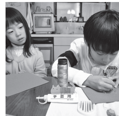
テクノ手芸部 Techno-Shugei Club

8/24(金) テクノロジー&手芸 「羊毛フェルトと電子部品で 目の光る動物をつくろう」