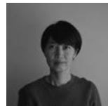
野口里佳 Rika Noguchi | 写真家

1980年生まれ。主な仕事に東京都写真美術館をはじめとした文化施設のVI計画、ブックショップ「POST」、The Tokyo Art Book Fairなどのアートディレクションや、アーティストの作品集制作も定期的に行なっている。飯田竜太(彫刻家)とのアーティストデュオ「Nerhol」としても活動。