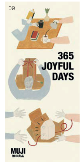
01 Reading 森の本(2018) 02 影はこわい(2018) 03 一緒に読む(2018) 04 今日の紙飛行機(2018) 05 Reading 夜の本 (2018) 06 絵を描く楽しさ(2018) 07 幻冬舎/サーカスナイト 著:よしもとばなな(2015) 08 暮らしの手帖社/暮らしの手帖別冊 こころからだのあたため読本/目次イラスト(2013) 09 良品計画/MUJI Xmas 2014/広告ポスター/アートディレクター:森本直樹(2014)