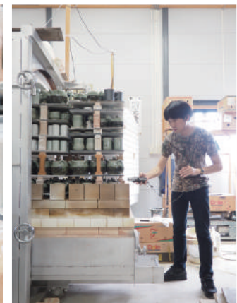
窯元での取材・録音の様子