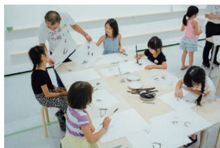
ワークショップ⑥「タイポグラフィ」講師:大日本タイポ組合