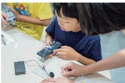
ワークショップ③「テクノロジー&手芸」講師:テクノ手芸部