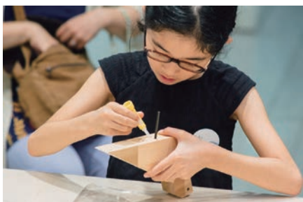
ワークショップ⑦「プロダクト」講師:トラフ建築設計事務所