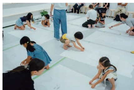
ワークショップ④「ファッション」講師:ミントデザインズ