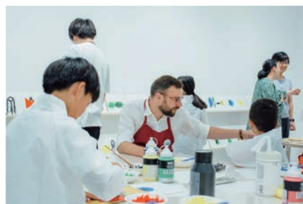
ワークショップ⑧「絵本・イラストレーション」 講師:バスチャン・コントレール