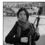
野口里佳 Rika Noguchi | 写真家

1980年生まれ。主な仕事に東京都写真美術館をはじめとした文化施設のVI計画、ブックショップ「POST」、「The Tokyo Art Book Fair」などのアートディレクションや、アーティストの作品集制作も定期的に行なっている。飯田竜太(彫刻家)とのアーティストデュオ「Nerho」としても活動。