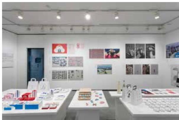
昨年開催の「日本のアートディレクション展2018」 展示風景より