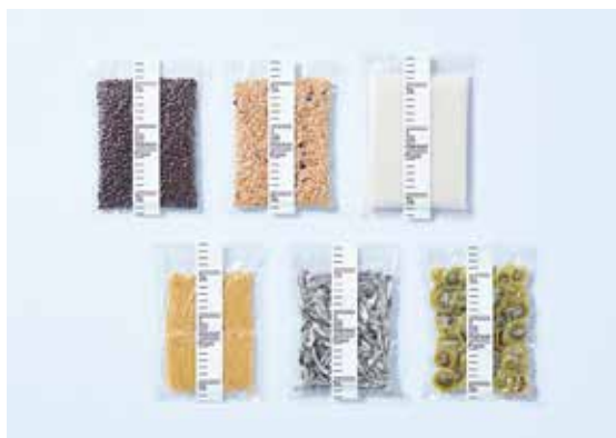
3cm market製作委員会「3cm market」の ポスター、パッケージデザイン、マーク&ロゴタイプ 柴谷 麻以 Mai Shibatani art director 嶋野 裕介 Yusuke Shimano creative director