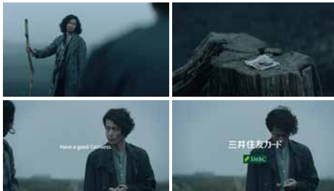
三井住友カード「企業広告」の商業フィルム 永井 聡 Akira Nagai film director 麻生 哲朗 Tetsuro Aso creative director, planner, copywriter