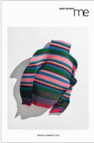
イッセイ ミヤケ「me ISSEY MIYAKE」の ポスター、ジェネラルグラフィック 野間 真吾 Shingo Noma art director