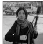
野口里佳 Rika Noguchi | 写真家

1980年生まれ。主な仕事に東京都写真美術館をはじめとした文化施設のVI計画、ブックショップ「POST」、『The Tokyo Art Book Fair』などのアートディレクションや、アーティストの作品集制作も定期的に行なっている。飯田竜太(彫刻家)とのアーティストデュオ「Nerhol」としても活動。