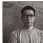
津田直 Nao Tsuda | 写真家

1980年生まれ。主な仕事に東京都写真美術館をはじめとした文化施設のVI計画、ブックショップ「POST」、The Tokyo Art Book Fairなどのアートディレクションや、アーティストの作品集制作も定期的に行なっている。飯田竜太(彫刻家)とのアーティストデュオ「Nerhol」としても活動。