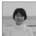
野口里佳 Rika Noguchi | 写真家

1976年神戸生まれ。世界を旅し、ファインダーを通して古代より綿々と続く、人と自然との関わりを翻訳し続けている。2001年より国内外で多数の展覧会を中心に活動。作品集に『SMOKE LINE』、『Storm Last Night』(共に赤々舎)、『Elnias Forest』(handpicked)など。大阪芸術大学客員教授。