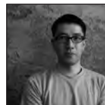
津田直 Nao Tsuda | 写真家

1976年千葉県生まれ。平木収氏に師事。在学中、東川町国際写真フェスティバルにボランティアとして参加。2003年から2010年まで同フェスティバル現場制作指導/アシスタントディレクターを務める。1998年からPGIにて写真の保存・展示業務に携わる。現在PGIのディレクターとして展覧会の企画運営を担当。