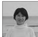
野口里佳 Rika Noguchi | 写真家

1976年生まれ。世界を旅し、ファインダーを通して古代より綿々と続く、人と自然との関わりを翻訳し続けている。作品集に『SMOKE LINE』、『Storm Last Night』(共に赤々舎)、『Elnias Forest』、『やがて、鹿は人となる/やがて、人は鹿となる』(共にhandpicked)など。大阪芸術大学客員教授。