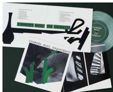
ギャラリーの企画展出品作品 「CHAMBER MUSIC FOR GREENERY」(org: OFSギャラリー)