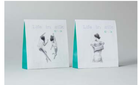
シルクウェアブランドのパッケージ「Nu」(cl: アトリエ ワイ)