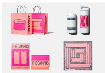
複合施設のグッズ「THE CAMPUS」(cl: ココヨ)