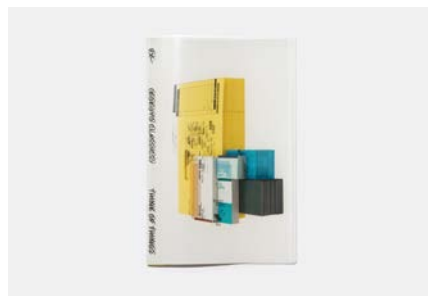
文具メーカーのツール・グッズ「EX」(cl: ココヨ)