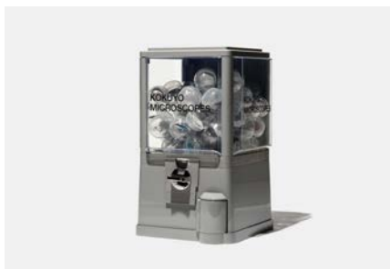
文具メーカーのグッズ「KOKUYO MICROSCOPES」 (cl: ココヨ)

1985年東京生まれ。2008年多摩美術大学プロダクトデザイン専攻卒業、同年ココヨ入社。商品ブランドの企画・デザイン、空間サイン計画、コーポレートブランディングなど、平面と立体を横断しながらデザインの仕事に取り組む。主な受賞に東京ADC賞、GOOD DESIGN AWARD金賞/BEST100、RED DOT DESIGN AWARD、KOKUYO DESIGN AWARDなど。 https://kanaisasaki.com