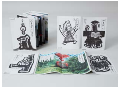
屋外作業機械メーカーの社内報「季刊誌やまびこ」(cl: やまびこ)