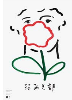
花いけワークショップのポスター「花あそ部」(cl: 花いけジャパンプロジェクト)