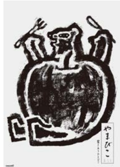
屋外作業機械メーカーの社内報のポスター「季刊誌やまびこ」(cl: やまびこ)

1982年東京生まれ。多摩美術大学グラフィックデザイン学科卒業。電通テック、ドラフトを経て、2019年に独立し現在に至る。 https://www.maeharashoichi.com