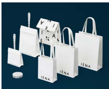
ファッションブランドのラッピングツール「IENA」 (cl: ベイクルーズ)

1986年神奈川県横浜市生まれ。多摩美術大学グラフィックデザイン学科卒業、2011年より資生堂クリエイティブ本部に所属。2021年独立。ビューティー系ブランドをはじめ、ファッションやジュエリーブランドのアートディレクション等を手掛ける。 https://www.mioritakeda.com