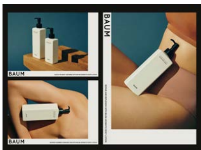
化粧品ブランドのポスター「BAUM」(cl: 資生堂)