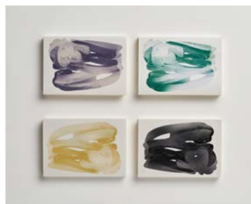
紙商社と広告情報誌の企画作品(ブックカバー) 「THE DETOUR」(cl: 竹尾/宣伝会議)